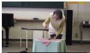
ろうそくの火を灯す