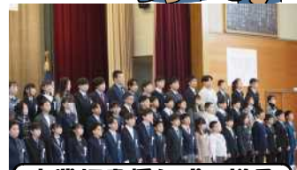
卒業証書授与式の様子

21日は、6年生の小学校生活の集大成となる卒業証書授与式がしめやかに行われました。小学校生活の「最後の授業」となる卒業式が、小学校生活での最高の思い出となったことと思います。さすが大國小学校の6年生です。短い練習期間の中でも、集中してすばらしい取組をしてくれました。合唱も呼びかけも6年生ならではの6年間の思いが込められていました。合唱曲は「旅立ちの日に」でした。合唱と呼びかけは、これまでで最高の出来映えだったと思います。